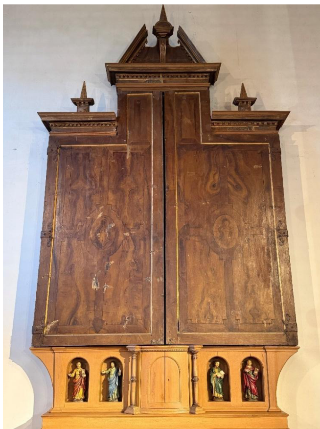
Altar Gutenthal in der Fastenzeit